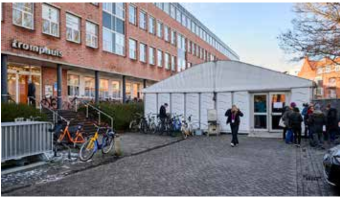
De cateringtent bij het Tromphuis.

130 mensen op kantoor. Dit zijn onder andere het team van marketing en we hebben eigen fotografen en videomakers. En dat is ook wat je 's nachts ziet, de medewerkers zijn dan hun foto's of video's aan het bewerken zodat het op onze mediakanalen gebruikt kan worden. Ook is ons kantoor de crewoffice, hier halen de medewerkers hun polsbandje op en bijvoorbeeld een portofoon. Na hun dienst midden in de nacht brengen ze hun spullen weer terug en zijn wij op kantoor om ze op te vangen. Het kantoor is echt de centrale plek tijdens het festival.”