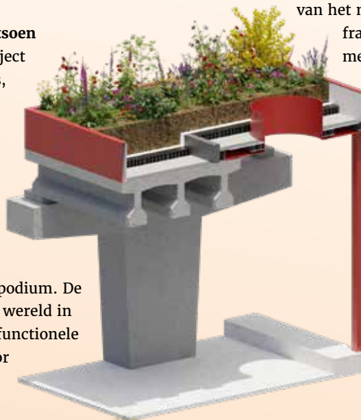
Detail van het Geheugenpaviljoen