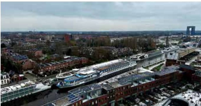
Hotelschepen in het Eemskanaal.

De stad bruist tijdens ESNS. Bij De Hoek op de Grote Markt staat een rij voor de eierballen. Er worden zelfs extra eierballen geleverd tijdens deze festivaldagen vanwege de grote vraag. Het is druk in de stad, maar de sfeer is altijd gezellig. Alle ov-fietsen in Groningen zijn verhuurd en het Eemskanaal ligt vol met hotelschepen. De hotels zitten propvol en naast het programma van Eurosonic zijn er ook veel cafés waar bandjes optreden.