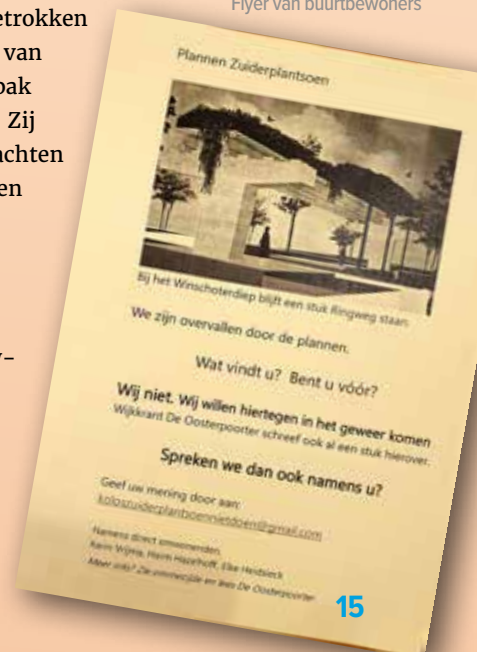
Flyer van buurtbewoners

De buurt zit nu in z’n maag met een plan voor een bouwwerk. Zij zullen het er vermoedelijk niet bij laten zitten. Dit verhaal krijgt zeer waarschijnlijk nog een vervolg. ∞