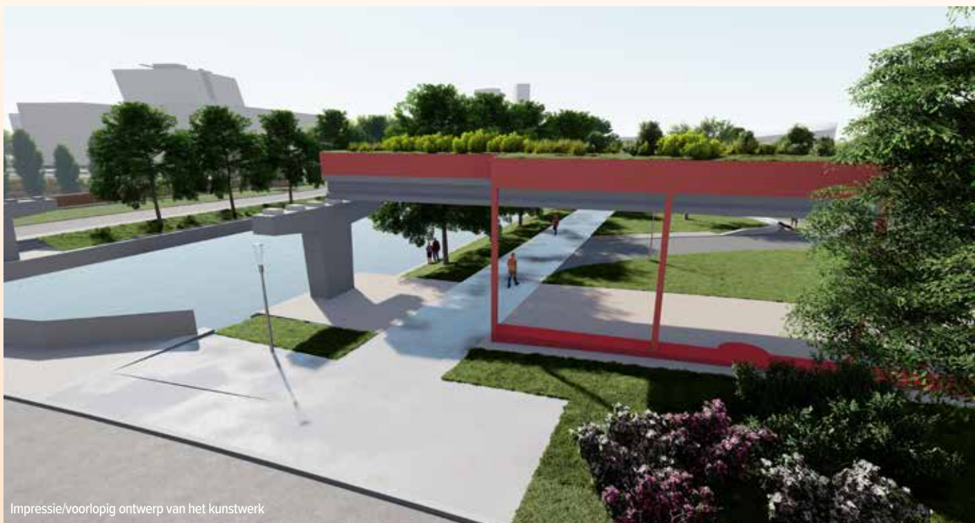
Impressie/voorlopig ontwerp van het kunstwerk

hoog op. “Waarom worden wij niet tussentijds geïnformeerd over de plannen?” was toen de vraag. “Er is in 2016 een inspraakronde geweest”, was het antwoord. “Dat was pijnlijk”, aldus Marguerite, “want daarmee werd gesuggereerd dat verdere inspraak niet meer mogelijk was. Er zijn toen buurtvertegenwoordigers kwaad de zaal uitgelopen”. Uiteindelijk werden de plannen over de inrichting van het Zuiderplantsoen begin november 2023 gepresenteerd. Marguerite: “Van tussentijdse informatierondes was geen sprake. De plannen rond de inrichting van het Zuiderplantsoen zijn verder zonder overleg met buurtbewoners ontwikkeld en uiteindelijk pas in november 2023 gepresenteerd”. Op de bijeenkomst dus, waar een aantal buurtgenoten zich rot zijn geschrokken